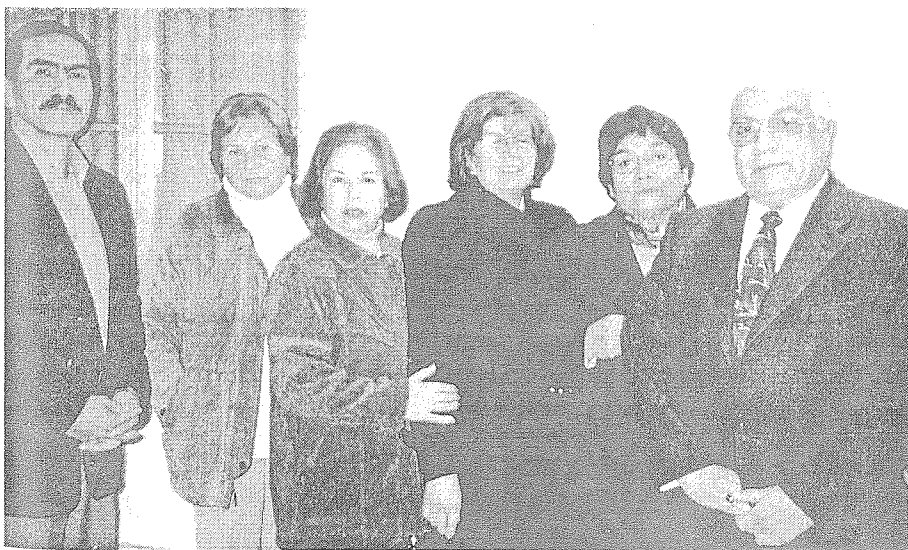
De Izq. A Derecha.